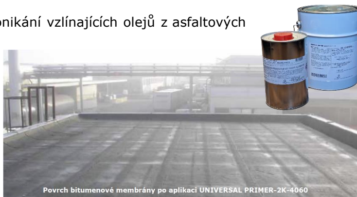
Povrch bitumenové membrány po aplikaci UNIVERSAL PRIMER-2K-4060

Jedná se o velmi rychlou penetraci. V horkých dnech ji proto nenechávejte např. v horkém autě. Čím více budou nádoby nahřáté, tím rychleji po smíchání materiál zreaguje a zhoustne. Nechte vytvrdnout cca 2-12 hodin (v závislosti na klimat. podmínkách).